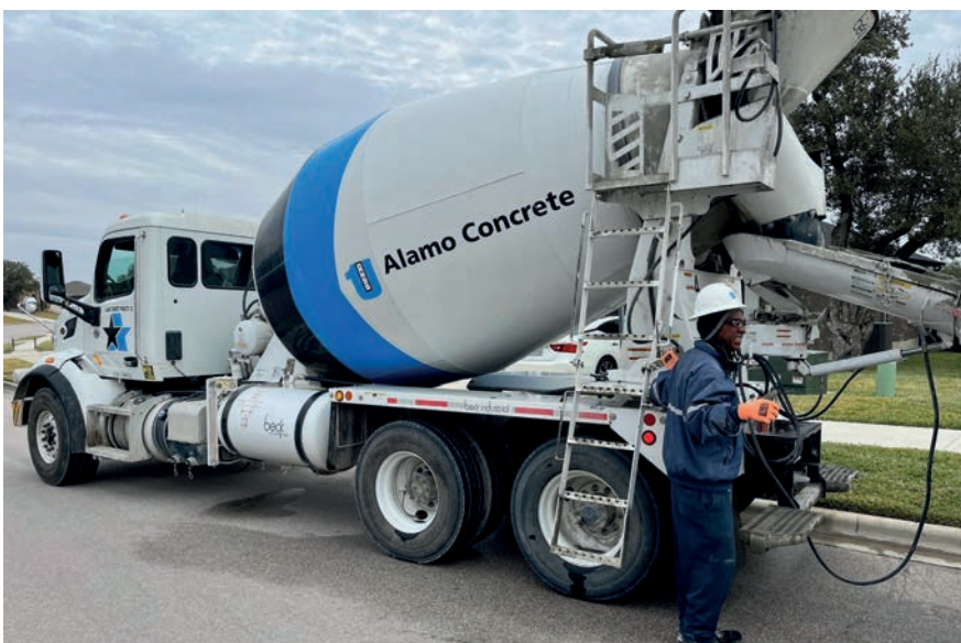
3. ALAMO CONCRETE PRODUCTS COMPANY TRUCK POURING THE STAIRS AND PAD CAMINHÃO DA ALAMO CONCRETE PRODUCTS COMPANY DESPEJANDO ESCADAS E BASE