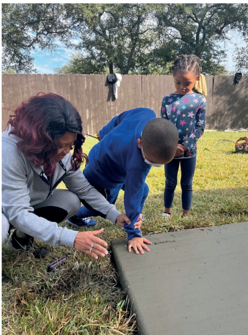
1. DJ MAKES HIS MARK ON ALAMO CONCRETE PRODUCTS COMPANY’S CONCRETE PAD DJ DEIXA SUA MARCA NO CONCRETO DA ALAMO CONCRETE PRODUCTS COMPANY

Alamo Concrete Products Company contributed to a Make-A-Wish project in Killeen, Texas. Founded in 1980, the Make-A-Wish Foundation is a national volunteer-based organization with a vision to grant the wish of every child diagnosed with a critical illness. Today, the organization grants a child’s wish every 34 minutes and can be the spark that creates a crucial turning point in their lives.